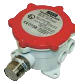
47K 3/4" NPT