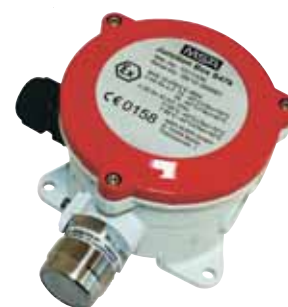
47K M25 x 1.5