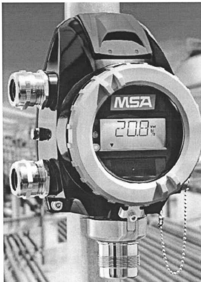
Рисунок 1 – Внешний вид газоанализаторов исполнений PrimaX I и PrimaX P