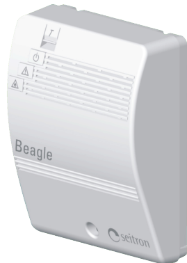
Рис. 1 Внешний вид