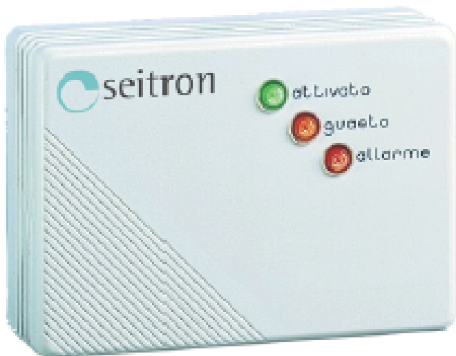
Рис1. Внешний вид

http://www.seitron.ru e-mail: seitron@kipa.ru